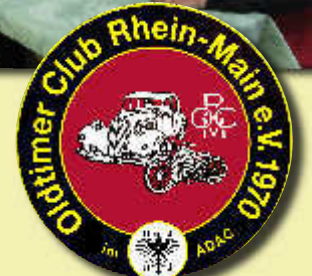
Gemälde von Antonia Burg