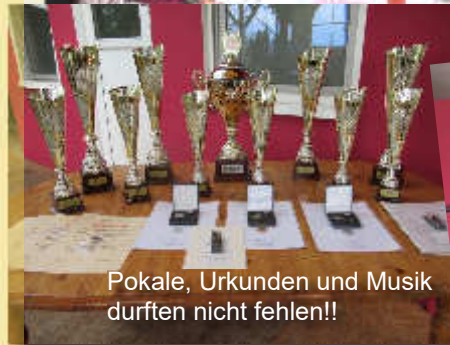
Pokale, Urkunden und Musik durften nicht fehlen!!