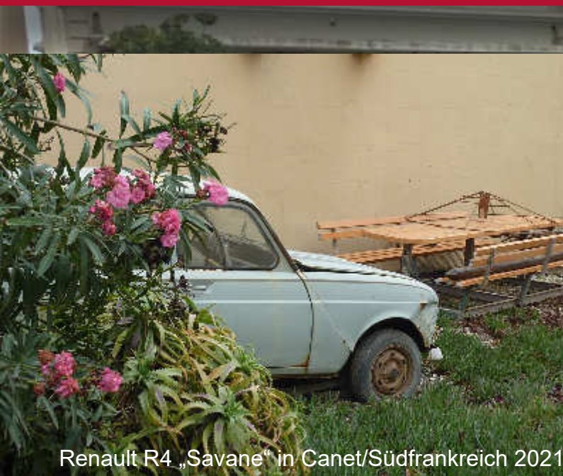
Renault R4 „Savane“ in Canet/Südfrankreich 2021