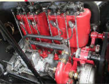
Buick von 1915