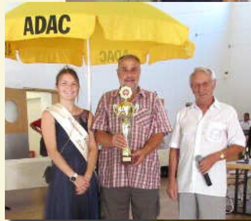
Ehre für die Besitzer der schönsten Fahrzeuge